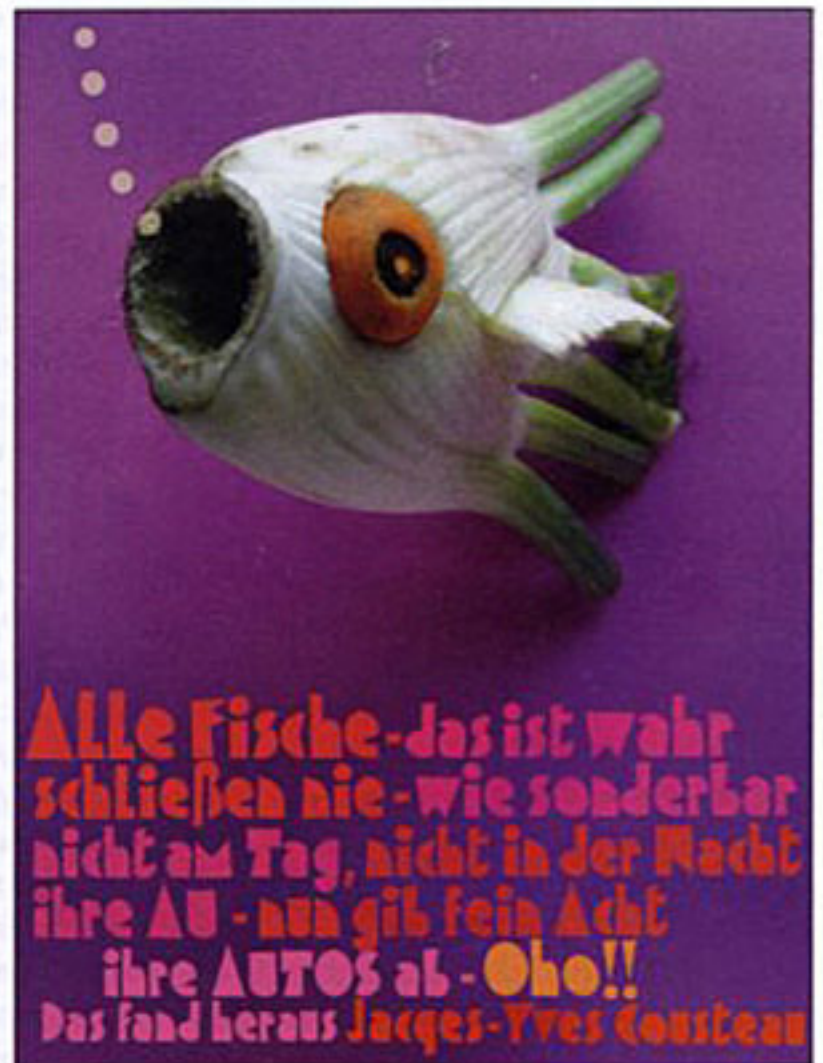
Der Illustrator Christian Hückstädt arbeitet gerne mit Materialien, die Formen und Farben vorgeben, um aus ihnen cartoonartige Wesen entstehen zu lassen. Nicht nur Früchte werden bei ihm zum Ausgangsmaterial für seine Illustrationen, auch deren Verpackungen verarbeitet er zu knallbunten Collagen ( www.hueckstaedt-illustration.de )